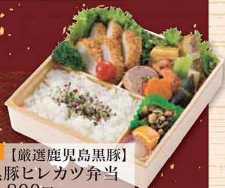
22 【厳選鹿児島黒豚】 黒豚ヒレカツ弁当 1,800円 (税込1,944円) サイズ/ 217×217×50mm