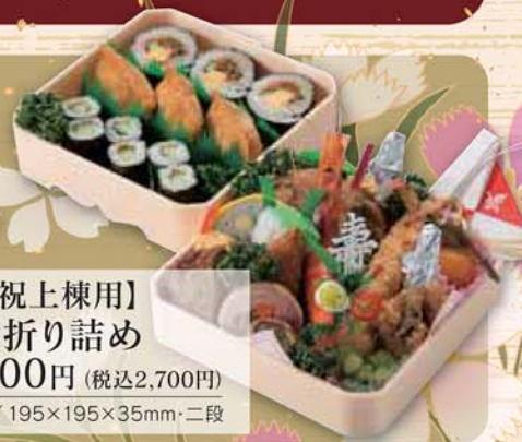
24 【祝上棟用】 会席折り詰め 2,500円 (税込2,700円) サイズ/ 195×195×35mm・二段