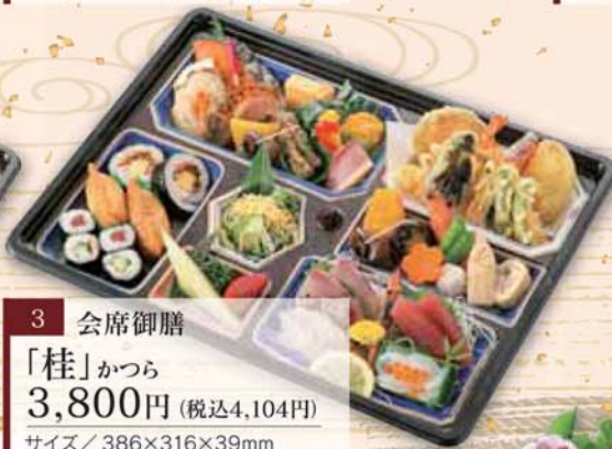
3 会席御膳 「桂」かつら 3,800円 (税込4,104円) サイズ/ 386×316×39mm