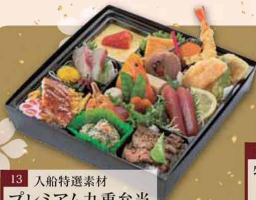
13 入船特選素材 プレミアム九重弁当 1,800円 (税込1,944円) サイズ/ 246×246×53mm

ご来賓ご来客、役員会議など 特別な場合には特別な厳選素材の 入船特選素材シリーズの お弁当をご利用ください。 おもてなしの心でお届けします。