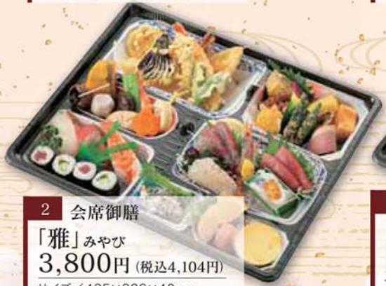
2 会席御膳 「雅」みやび 3,800円 (税込4,104円) サイズ/ 435×326×40mm