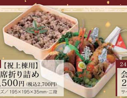
23 【祝上棟用】 会席折り詰め 2,500円 (税込2,700円) サイズ/ 195×195×35mm・二段