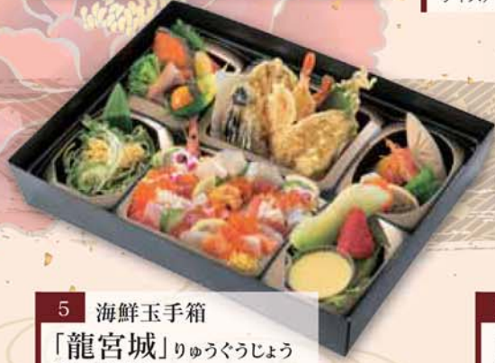
5 海鮮玉手箱 「龍宮城」りゅうぐうじょう 3,500円 (税込3,780円) サイズ/ 352×257×66mm