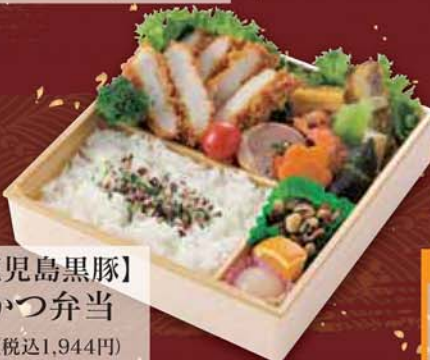
21 【厳選鹿児島黒豚】 黒豚とんかつ弁当 1,800円 (税込1,944円) サイズ/ 217×217×50mm