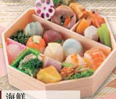
12 海鮮 てまり寿司御膳 1,500円 (税込1,620円) サイズ/ 205×205×50mm