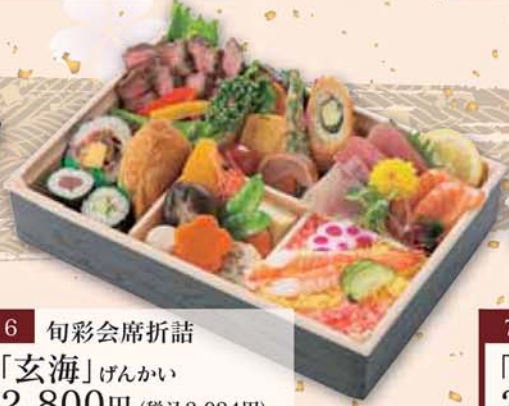
6 旬彩会席折詰 「玄海」げんかい 2,800円 (税込3,024円) サイズ/ 270×181×50mm