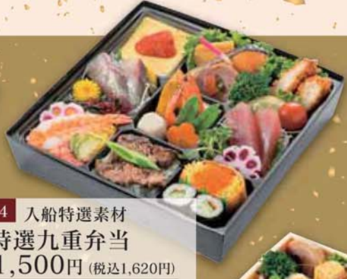
14 入船特選素材 特選九重弁当 1,500円 (税込1,620円) サイズ/ 246×246×53mm