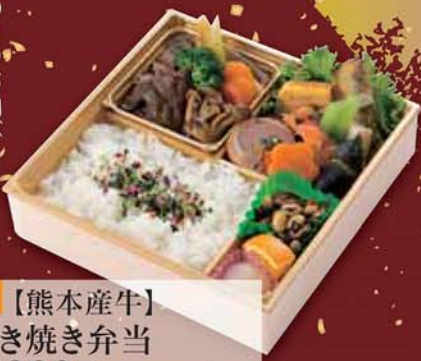
19 【熊本産牛】 すき焼き弁当 2,200円 (税込2,376円) サイズ/ 217×217×50mm