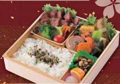
18 【熊本産牛】 ステーキ弁当 2,200円 (税込2,376円) サイズ/ 217×217×50mm