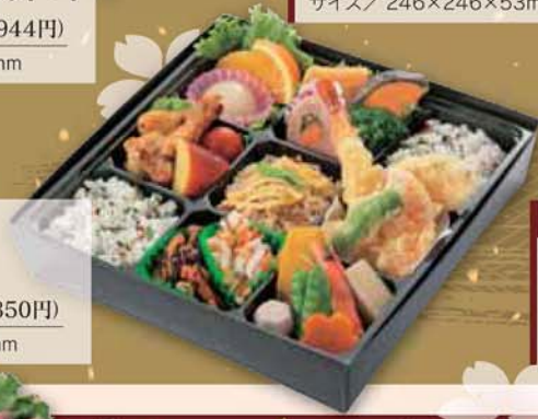
15 入船特選素材 九重弁当 1,250円 (税込1,350円) サイズ/ 246×246×53mm