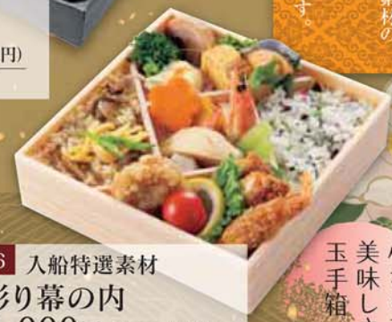
16 入船特選素材 彩り幕の内 1,000円 (税込1,080円) サイズ/ 180×180×45mm