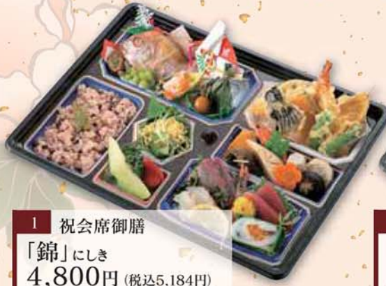
1 祝会席御膳 「錦」にしき 4,800円 (税込5,184円) サイズ/ 435×326×40mm