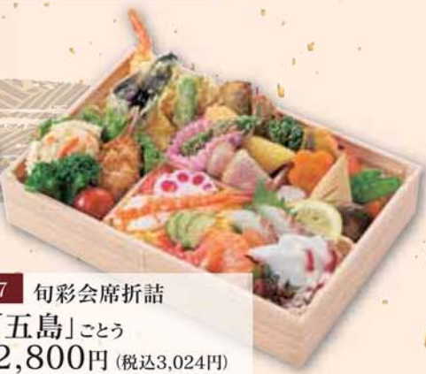
7 旬彩会席折詰 「五島」ごとう 2,800円 (税込3,024円) サイズ/ 270×181×50mm