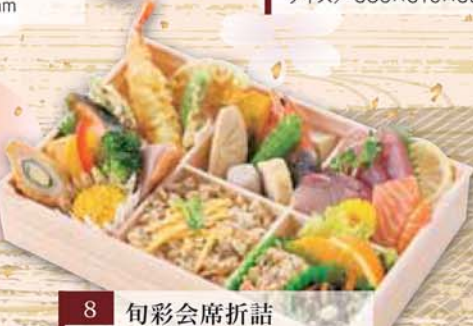
8 旬彩会席折詰 「天草」あまくさ 2,300円 (税込2,484円) サイズ/ 270×181×50mm