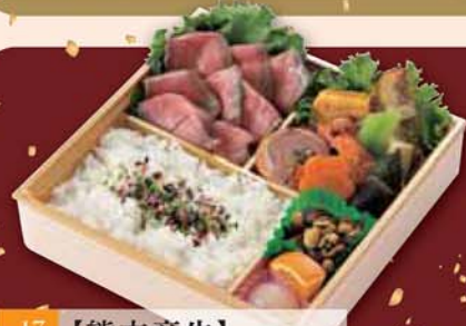
17 【熊本産牛】 ローストビーフ弁当 2,200円 (税込2,376円) サイズ/ 217×217×50mm