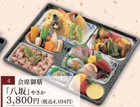
4 会席御膳 「八坂」やさか 3,800円 (税込4,104円) サイズ/ 386×316×39mm