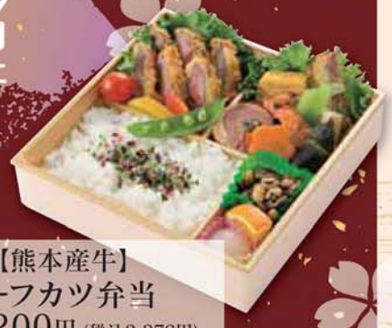
20 【熊本産牛】 ビーフカツ弁当 2,200円 (税込2,376円) サイズ/ 217×217×50mm